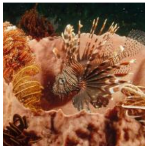
Aunque es de discreto tamaño, el pez no tiene depredadores naturales, al menos en el océano Atlántico